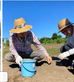
白菜とニンニクの植え付け

収穫した里芋を、試食を兼ねて11月のイベントで食べました。イベントの様子は次号でお伝えします♪