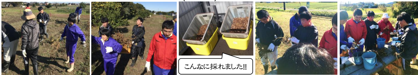
こんなに採れました!!

冷たい風が吹く季節になってきました。畑では11月中旬から里芋の収穫を進めています。黒豆も収穫し、鞘取りを終えました。鞘取りの時、ある利用者さんは、はじめのうちは2、3個の鞘の取り残しがありました。が、「もう付いてない?」「よく見てね」などと声を掛けられるうちに、自主的に確認し、取り残しに気付けるようになりました(*'▽'*)