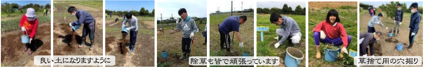
良い土になりますように