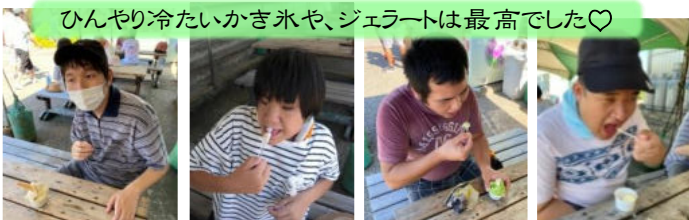
ひんやり冷たいかき氷や、ジェラートは最高でした♡