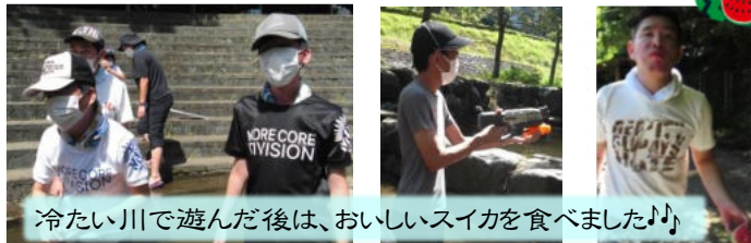
冷たい川で遊んだ後は、おいしいスイカを食べました♪