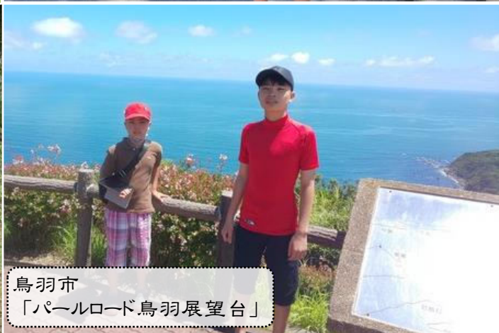
鳥羽市 「パールロード鳥羽展望台」