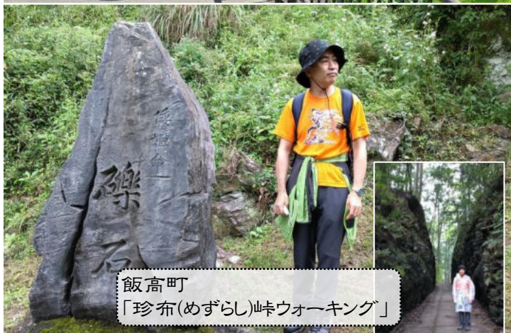
飯高町 「珍布(めづらし)峠ウォーキング」