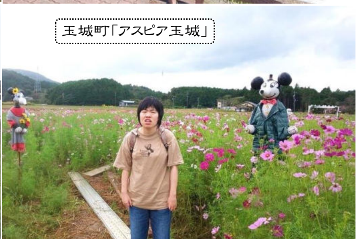
玉城町「アスピア玉城」