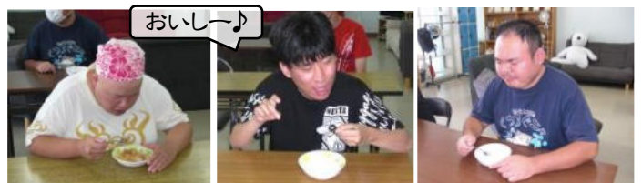
レモネードやアップルティーなど、4種類のシロップから好きなものを選んでかけました! みんな少しずつ色んな味を楽しみました♪