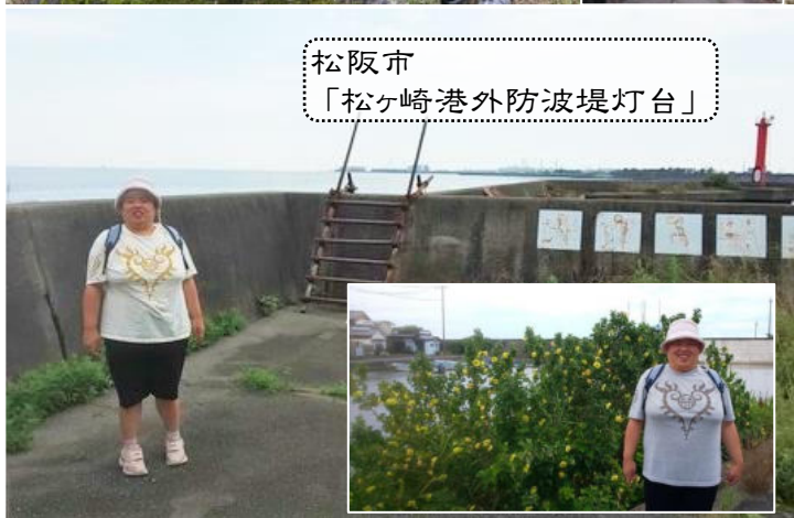
松阪市 「松ヶ崎港外防波堤灯台」