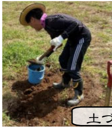
土づくりは野菜栽培の基本です!

夏野菜の撤去も終わり、土づくりと冬野菜の準備を進めています。まずはニンジンと大根の種まきが終わりました。10月の上旬にはサツマイモを収穫しました。シャベルで傷をつけないように畝の周囲から掘り起こし、顔を出した芋を両手で掴み引き抜きます。「大きいな〜」引き抜いた芋を見ると笑顔がこぼれます。収穫はやはり嬉しいですね♪芋は糖度を増すため2週間程寝かせますので、10/20(水)からの販売となります。注文はお受けしておりますので、是非お声掛けください(*^^*) バリ取りの受注仕事は継続的に頂けており、慣れからのミスが無いよう声を掛け合い取り組んでいます。