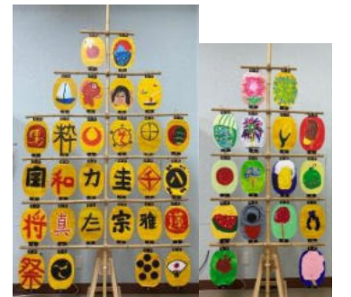
心躍る作品に仕上がりました♪