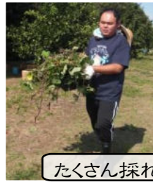
たくさん採れました!!