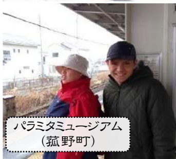
パラミタミュージアム (菰野町)