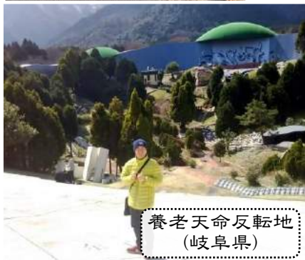
養老天命反転地 (岐阜県)