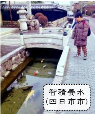
智積養水 (四日市市)