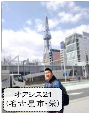
オアシス21 (名古屋栄)