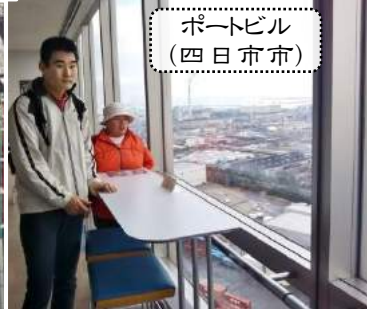
ポートビル (四日市市)