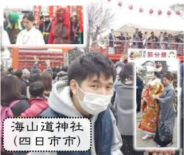
海山道神社 (四日市市)

＜お知らせ＞ ・見学者、その他お問い合わせなど、随時受け付けています。 ・一緒に働いてくださる支援員さんを募集しています。お気軽にお問い合わせ下さい! ・ホームページ上では、会報紙をカラーでご覧いただけます。