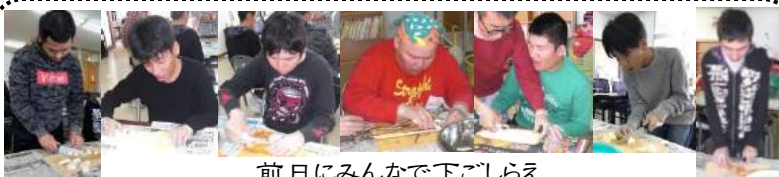
前日にみんなで下ごしらえ