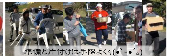
準備と片付けは手際よく(●●●●)