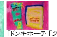
「ドンキホーテ「グランモンセラー」 冒険の旅」