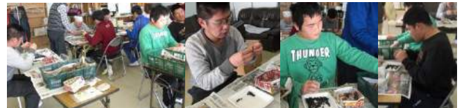
今年豊作だった黒豆とみかん

12/17(日)、クラギ文化ホールで開催された「第13回松阪市福祉大会」に出店し、農作物とオリジナル製品を販売しました。メモ帳、黒豆、みかん、里芋が好評で、多くの方々にお買い上げ頂きました。ありがとうございました!