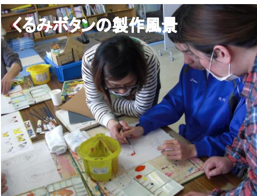
くるみボタンの製作風景

オリジナル製品は、くるみボタンを中心に製作しています。デザイン、素材、耐久性などについて、試作、見直しを繰り返してきましたが、いよいよ近日内に販売します！商品作りの他、自主販売を目指した準備も着々と進んでいます。