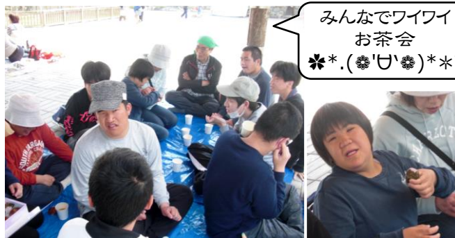
みんなでワイワイお茶会 *.*(๑'๓)/**

花見 4/5(金)に松坂城公園へ行きました。天気にも恵まれ、満開の桜を存分に楽しんできました♪