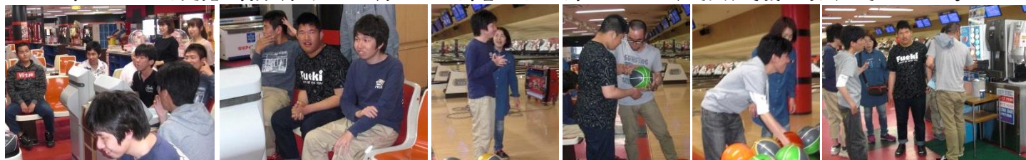
2レーンにわかれて投球

レーン、ピンをしっかりと見据え、投球! みんなで悔しがったり、喜びあったり、いつもと一味違う有意義な時間を過ごせました!