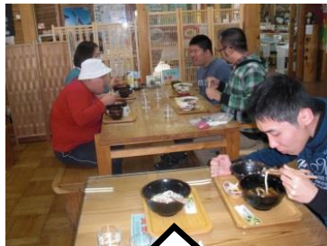
昼食は「木つつ木館」にて