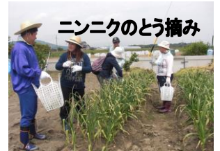
ニンニクのとう摘み