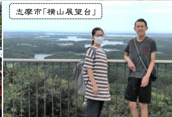
志摩市「横山展望台」