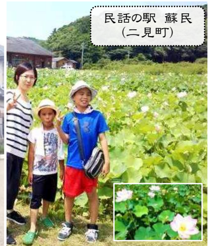
民話の駅 蘇民 (二見町)