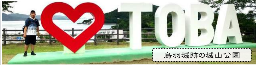
鳥羽城跡の城山公園