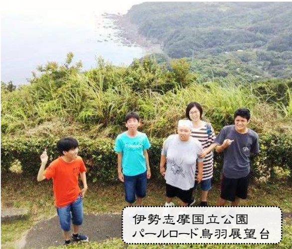
伊勢志摩国立公園 パールロード鳥羽展望台