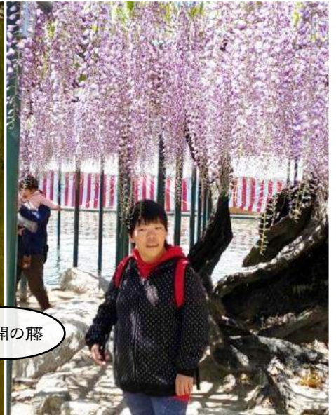
天王川公園 (愛知県津島市)