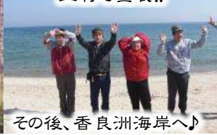
その後、香良洲海岸へ♪