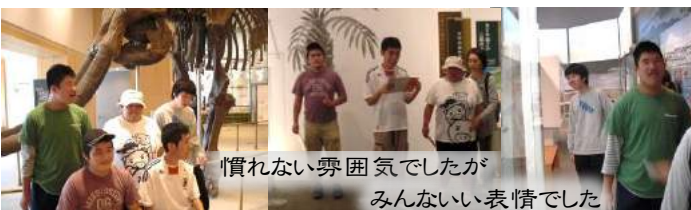
慣れない雰囲気でしたがみんないい表情でした