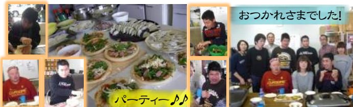
おつかれさまでした!