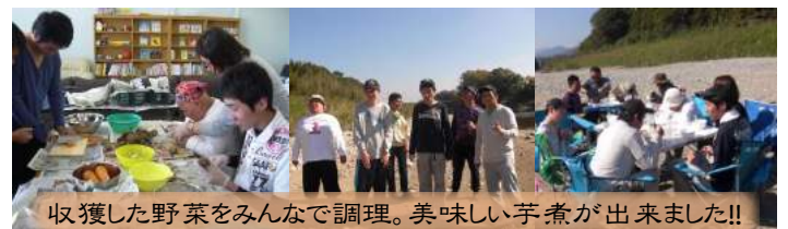
収穫した野菜をみんなで調理。美味しい芋煮が出来ました!!