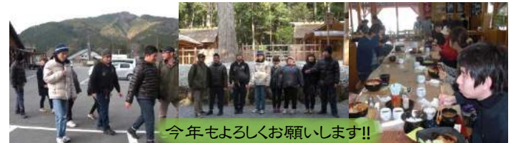
今年もよろしくお願いいたします!!